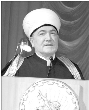
Окончание. Начало на 1-й стр.

По его словам, государство оказывает огромную поддержку традиционному религию. Религиозные деятели в свою очередь должны показывать пример консолидации сил.